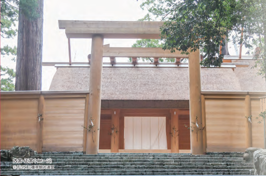
内宮・正宮(イメージ)

個人ではなかなか体験する機会も少ないご祈禱を「御神楽」という形でご奉仕いたします。雅楽の調べと倭舞といわれる舞の奉納で皆様のご願い事をご神前にお届けいたします。