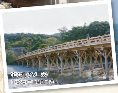
宇治橋(イメージ)