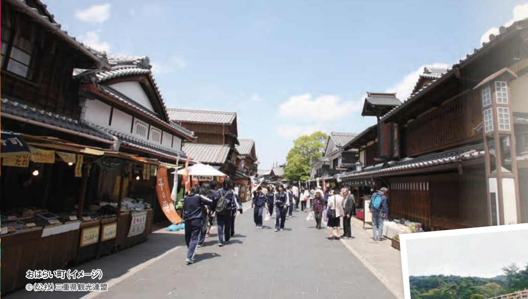
おはらい町(イメージ)