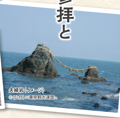
夫婦岩(イメージ)