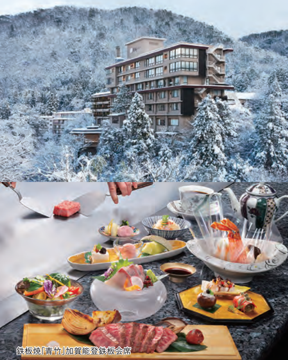
鉄板焼「青竹」加賀能登鉄板会席

■お問い合わせ・ご予約 / ☎0761-78-5656 加賀市山中温泉東町1丁目ホ14-3